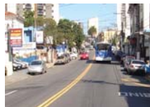
Avenida Água Fria

Se você ainda não viu vale a pena conferir: a Ataliba Leonel está de cara nova entre a avenida Cruzeiro do Sul e a praça Orlando Silva, após o recapeamento e sinalização de 1.200 metros. O canteiro central foi reformado, ganhou piso novo, grama e mudas de árvores entre a Avenida Cruzeiro do Sul e a rua Dr. Arthur Guimarães, José Debieux, Benvindo Aparecida de Abreu Leme, Pêrpetuo Júnior e acessos à